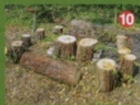
Le Laboratoire du Dehors